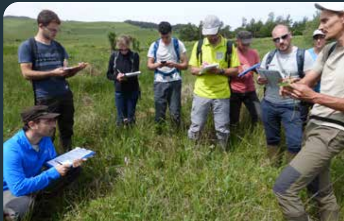
Atelier biodiversité des zones humides - juillet 2020