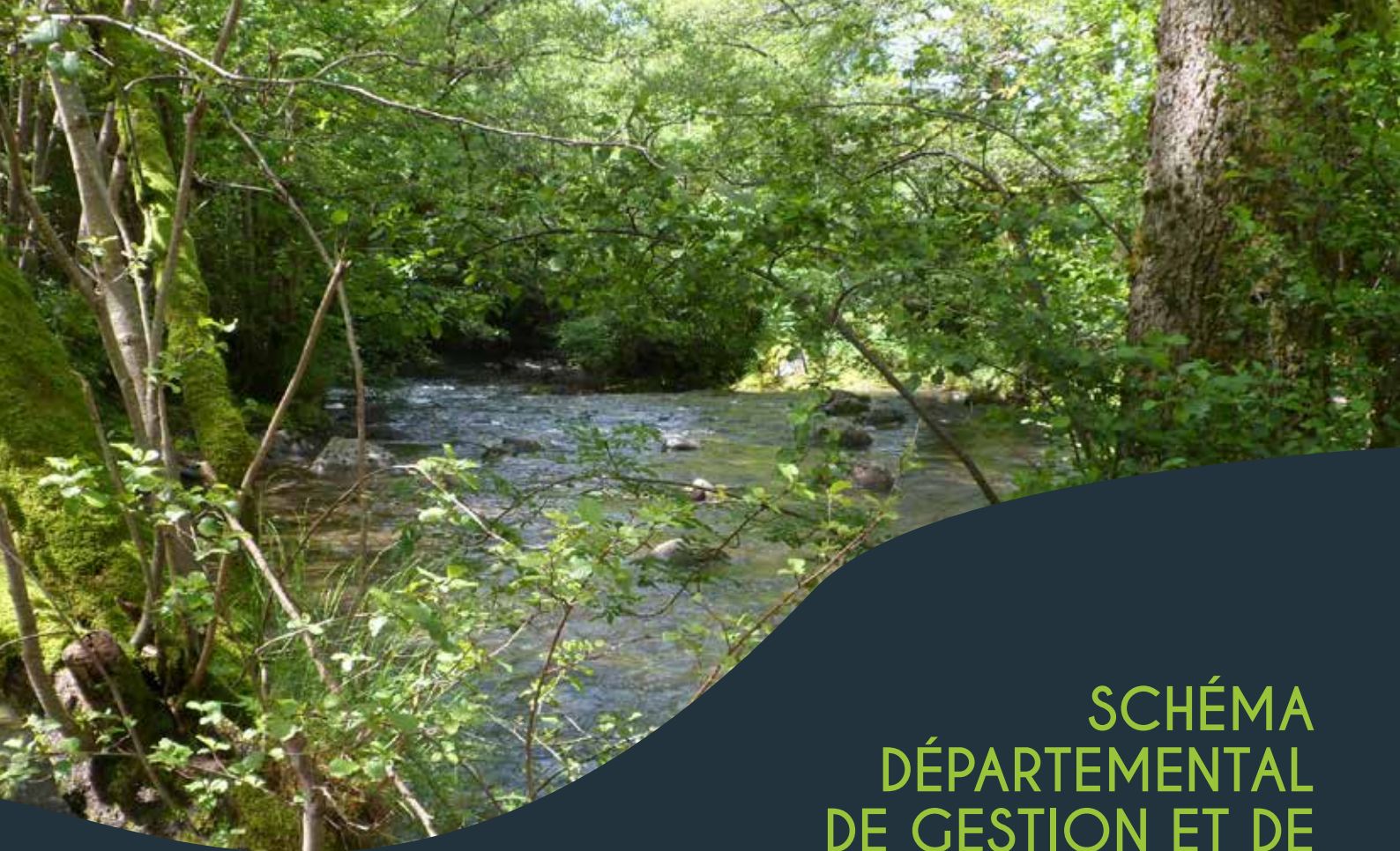
SCHÉMA DÉPARTEMENTAL DE GESTION ET DE VALORISATION DES MILIEUX AQUATIQUES 2014-2024

BILAN ET EVALUATION À MI-PARCOURS ÉVOLUTIONS 2021-2024