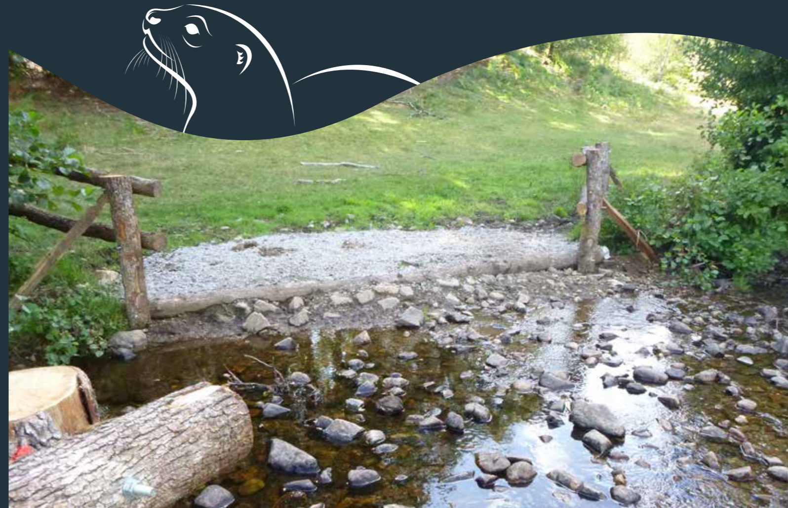
Groupe technique milieux aquatiques - mai 2019