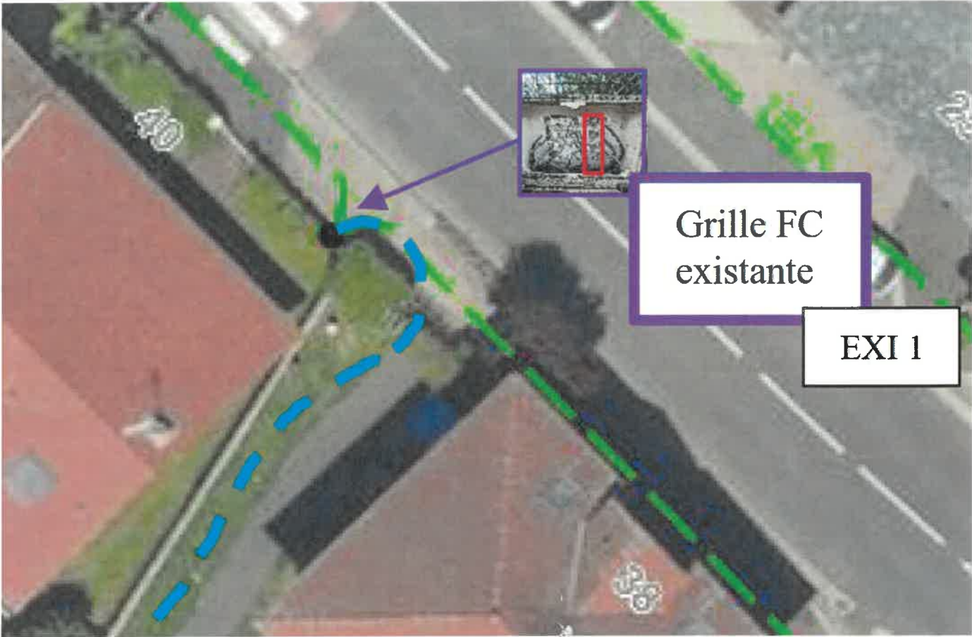
Schéma n°10 sous trottoir ou sous accotement revêtu RD catégories 1, 2 et 3