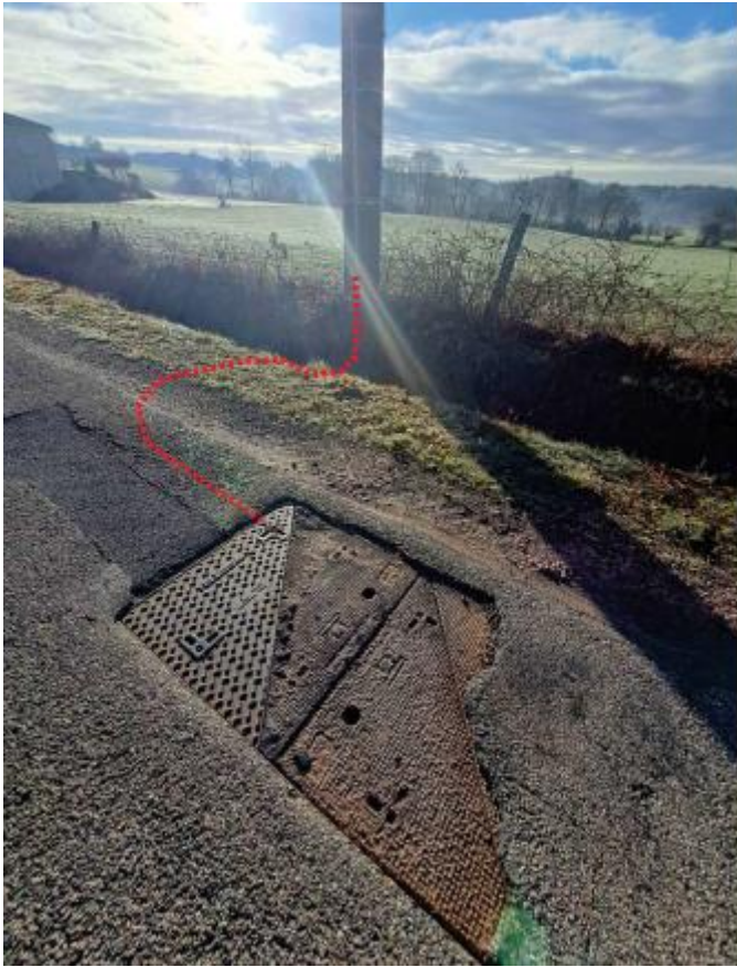
Schéma n°6-2 tranchée sous accotement située à une distance du bord de chaussée inférieure à 0,75m pour les RD des catégories cat.1, 2 et 3