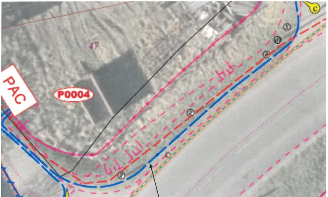
Tranchée en accotement longueur 20m Schéma 6.1