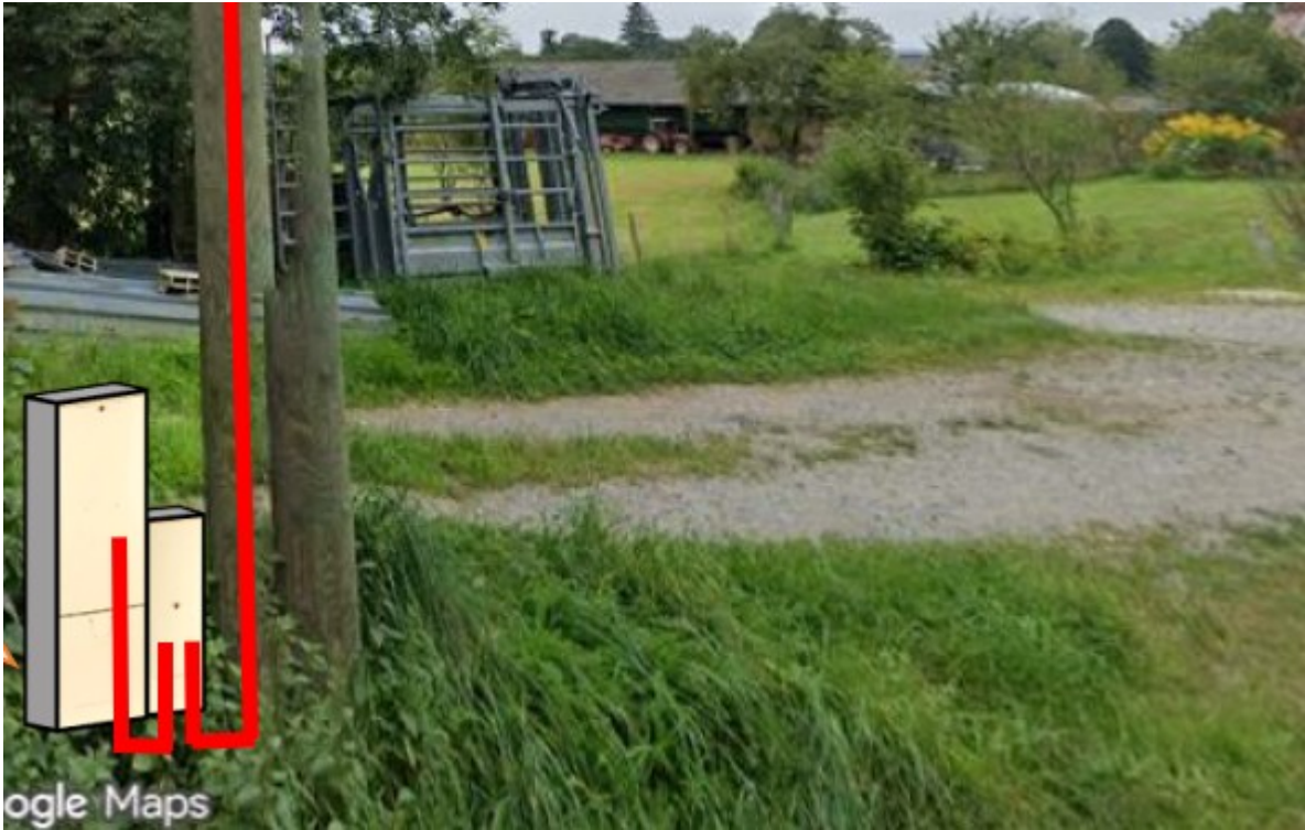
Schéma n°7 Tranchée isolée sous chaussée de toutes les RD (cat. 1, 2 et 3) (projet à faible impact type branchement particulier)