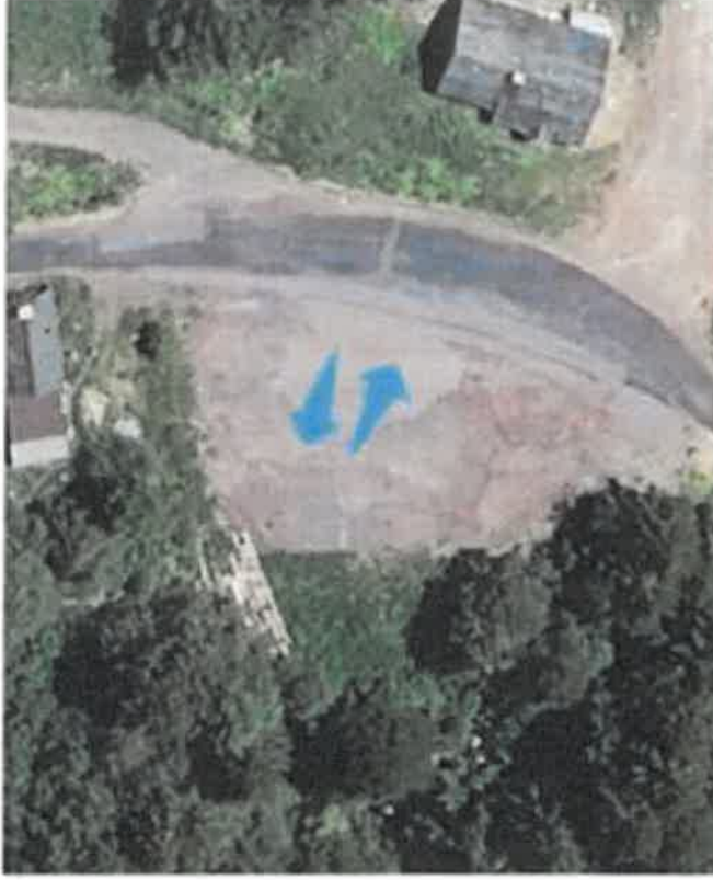
Embarquement et dépôt des usagers