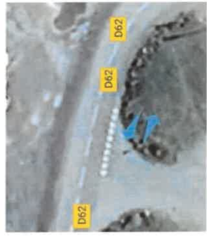
Embarquement et dépose des usagers