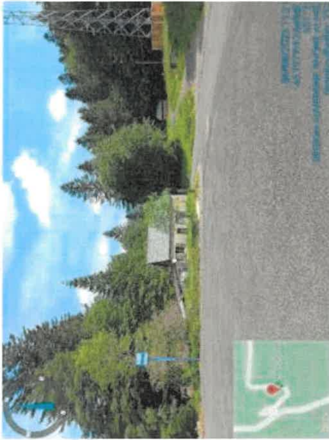
Implantation poteau temporaire