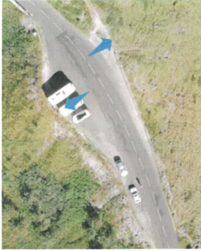
Embarquement et dépôt des usagers