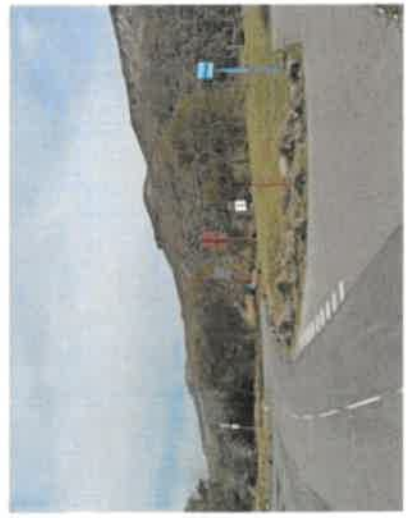
Implantation poteau temporaire