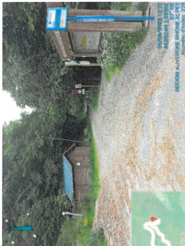
Implantation poteau temporaire