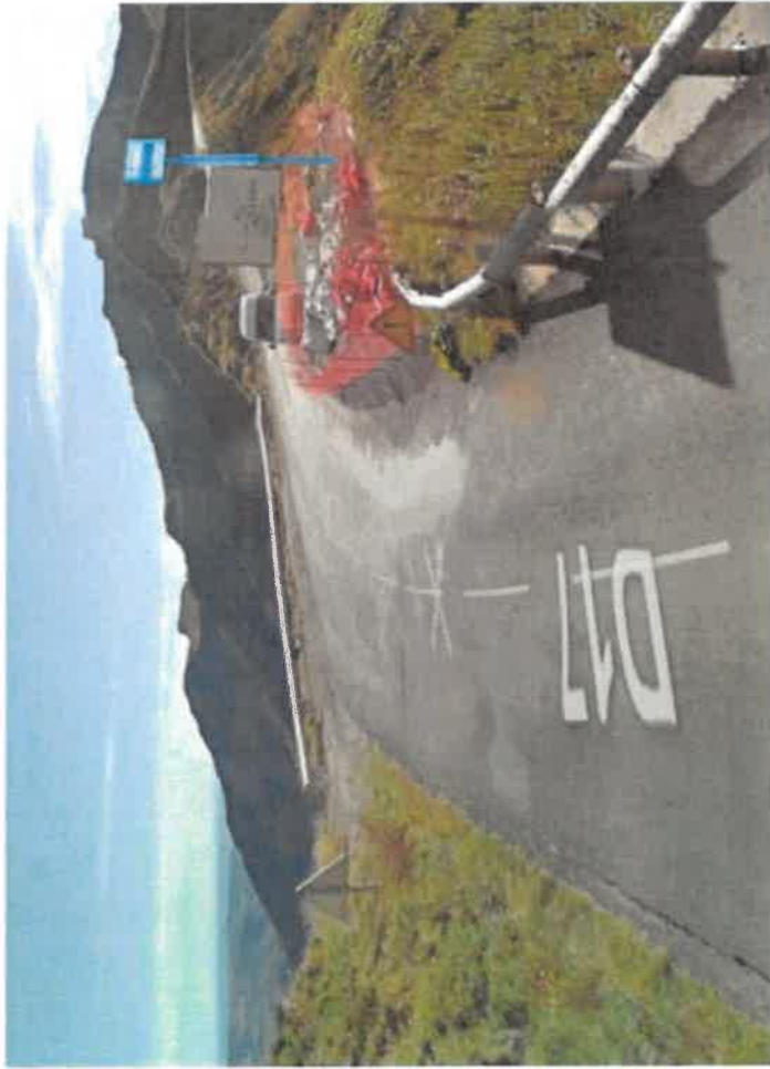
Implantation poteau temporaire