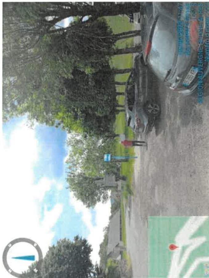
Implantation poteau temporaire