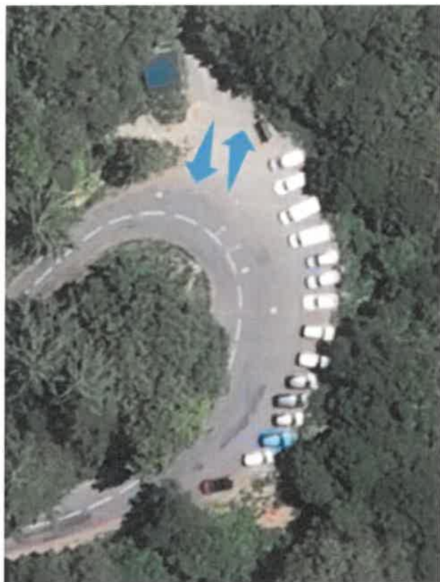
Embarquement et dépose des usagers