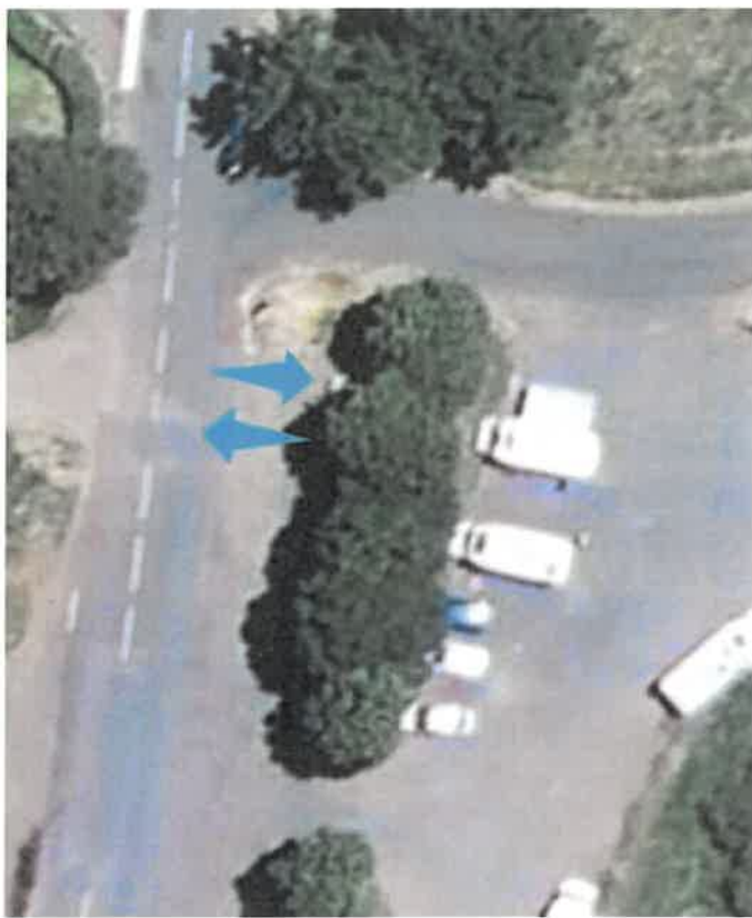
Embarquement et dépôt des usagers